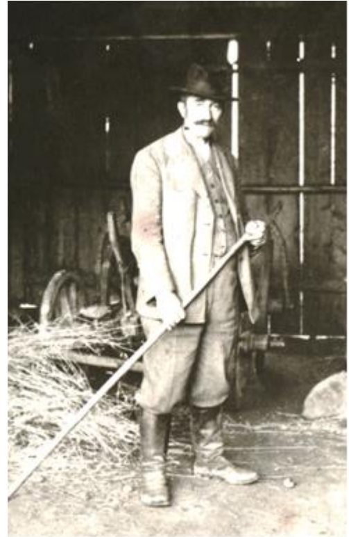
Zdjęcie 1 i 2. Wincenty Witos w tradycyjnym ubiorze chłopskim z I poł XX w.

Czy zauważyłeś coś w stroju, co mnie różni się od eleganckiego garnituru twojego taty czy dziadka? Podpowiem ci co znaczy nosić się po chłopsku, to znaczy ubierać się jak chłop, rolnik czyli ja. Zawsze noszę białą koszulę zapiętą na ostatni guzik, noszę kapelusz, wysokie buty z cholewami i nigdy nie zakładam krawatu.